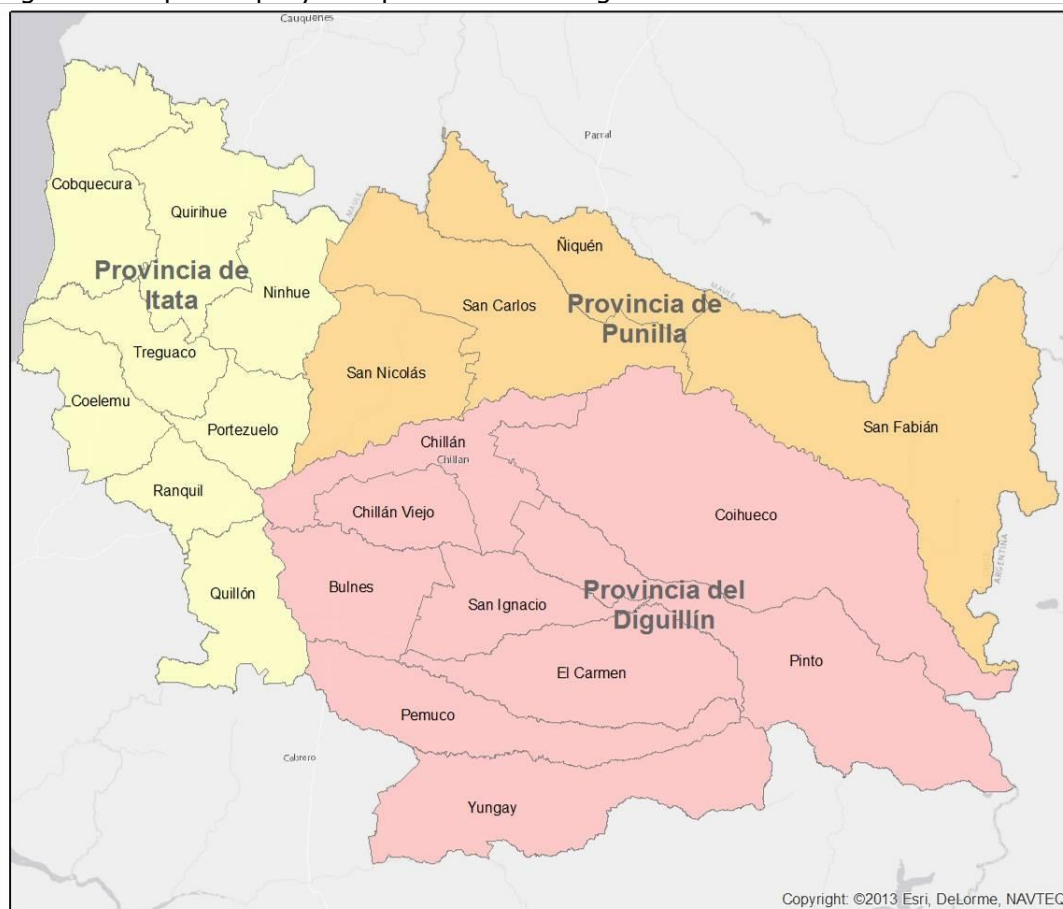
Figura 1. Mapa del proyecto para crear la Región de Ñuble